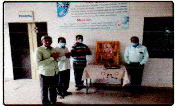
छत्रपती शिवराज्यभिषेक दिन