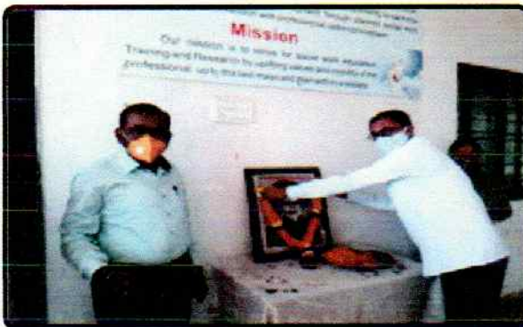
महात्मा फुले जयंती